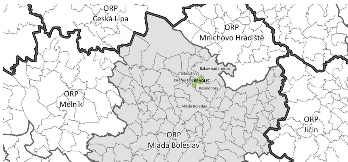
Obr. 1 Širší vztahy v území